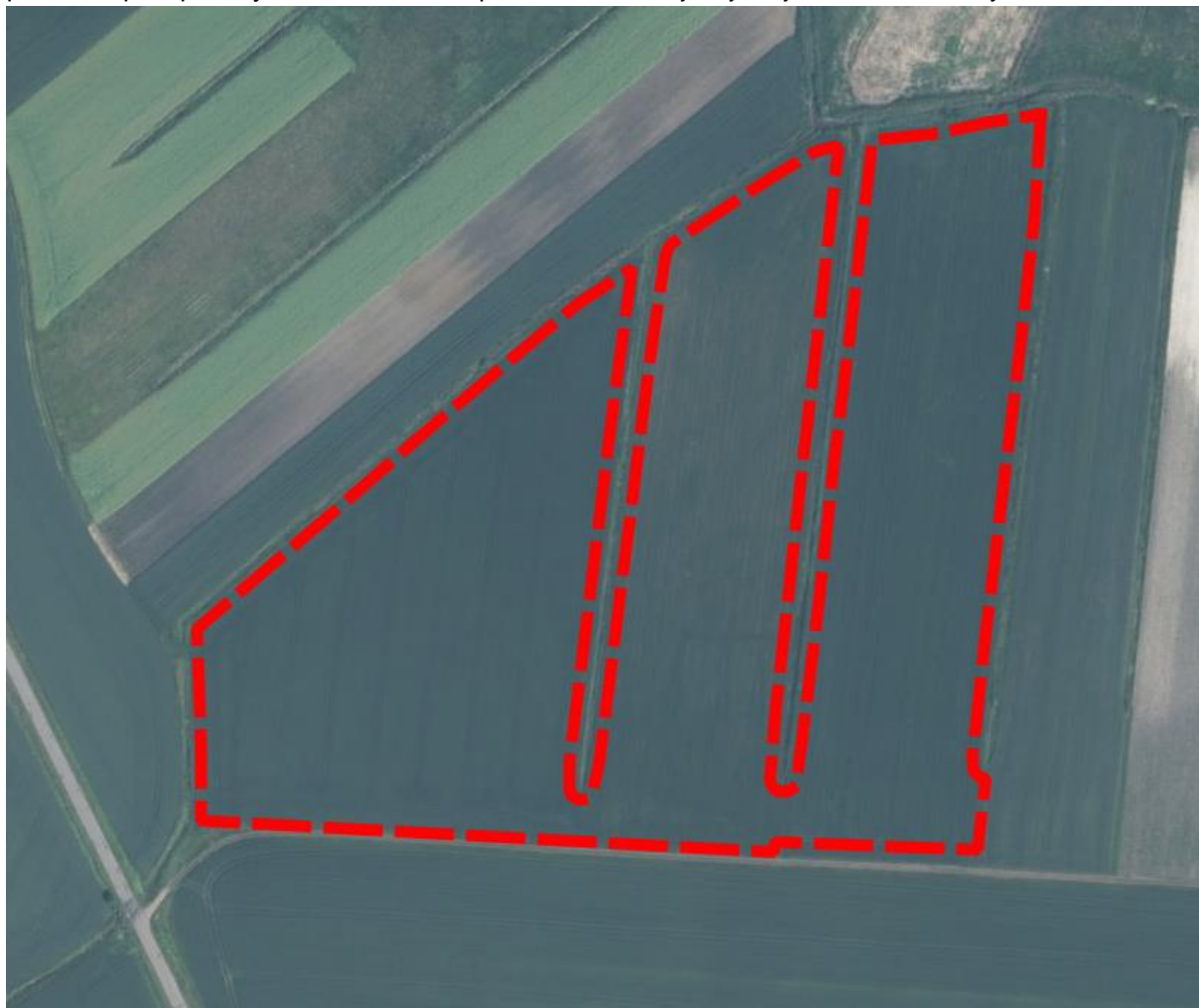
Rysunek 2 Położenie obszaru opracowania na ortofotomapie

W krajobrazie obszaru opracowania i jego otoczenia dominują tereny otwarte w formie łąk, pastwisk, pól uprawnych. Na obszarze opracowania brak jest jakiegokolwiek zabudowy.